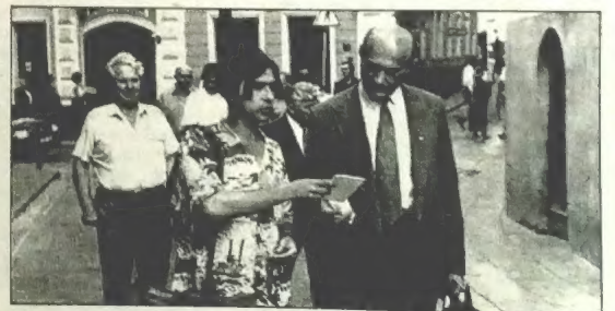
Вандруюць па Вільні.